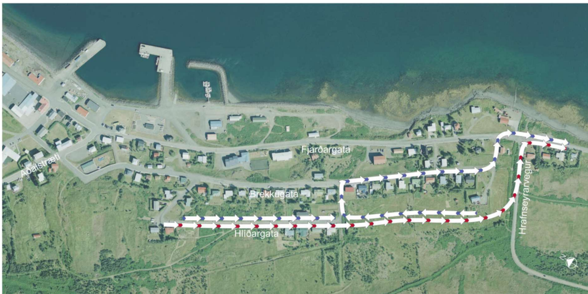
Mynd 4 Mögulegar akstursleiðir út úr bænum frá byggð við Hlíðarveg. Blá lína sýnir líklega leið í dag en rauð lína sýnir líklega leið ef Hlíðargata tengist Hrafnseyrarvegi.

Brekkugata hefur beina tengingu við Fjarðargötu, um 50 m utan við gatnamót Hrafnseyrarvegar. Gert er ráð fyrir töluverðum fjölda nýrra íbúða við Hlíðargötu og það mun auka umferð um Brekkugötu ef ekki kemur til nýrrar tengingar við Hrafnseyrarveg. Öll umferð af Hlíðargötu myndi þá fara um Brekkugötu og áfram þaðan um Fjarðargötu/Þingeyrarveg (blá leið á Mynd 4.)