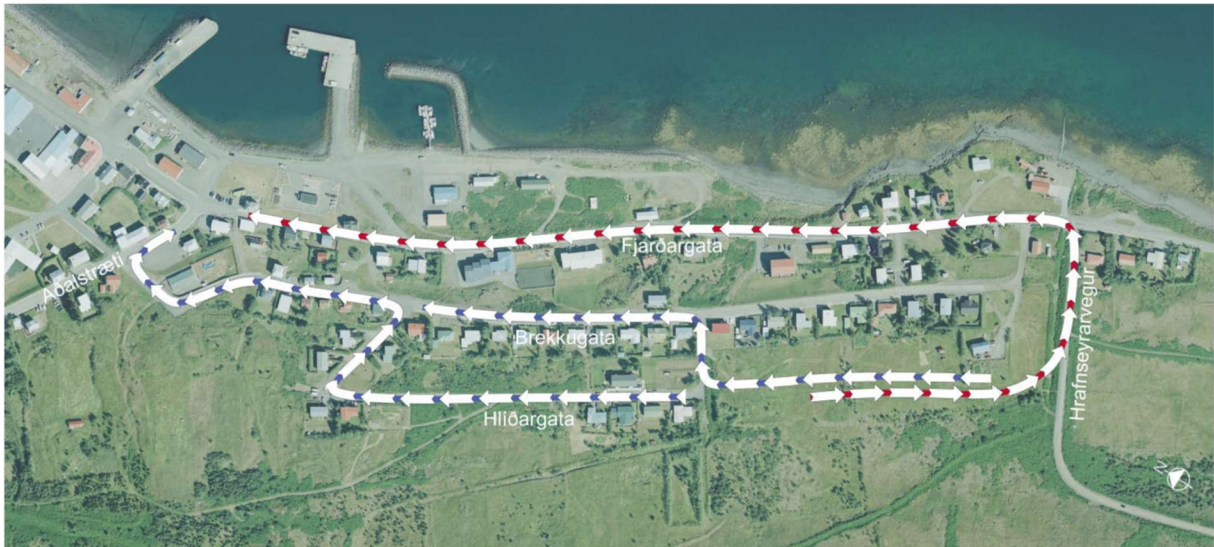
Mynd 5 Mögulegar akstursleiðir frá byggð við Hlíðarveg að miðsvæði Píngeyrar. Líklegt er að flestir muni velja að fara um Brekkugötu þrátt fyrir tengingu við Hrafnseyrarveg (blá lína). Þeir sem búa næst Hrafnseyrarvegi gætu þó valið að fara þá leiðina þar sem hún verður greiðari (rauð lína).

Fjölgun lóða við Hlíðargötu mun auka umferð um götuna. Með tengingu Hlíðargötu við Hrafnseyrarveg mun umferðaraukning vegna fjölgunar íbúða dreifast á fleiri tengingar í stað þess að öll umferð frá Hlíðargötu fari um Brekkugötu, sem ætti ekkert síður en Hlíðargata að vera róleg íbúðargata. Fyrir þá sem búa á innsta hluta Hlíðargötu gæti Hrafnseyrarvegur verið betri valkostur á leið til skóla eða annarrar þjónustu í þorpinu (rauð leið á Mynd 5) sem myndi um leið minnka aukningu umferðar um Brekkugötu.