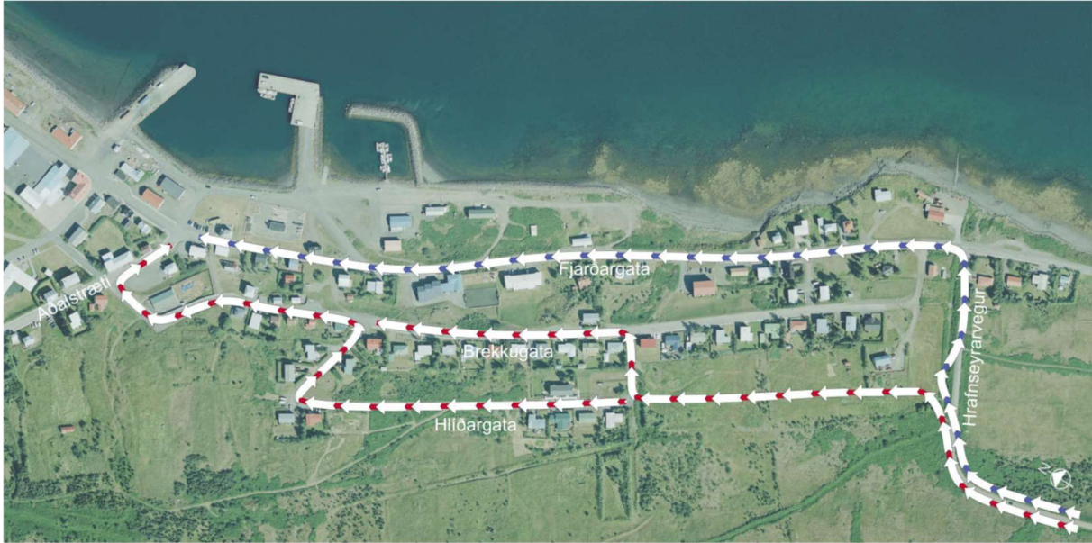
Mynd 3 Mögulegar akstursleiðir frá Hrafnseyrarvegi að miðsvæði Þingeyrar ef Hlíðargata er tengd við þann veg. Ólíklegt er að leiðin um Hlíðargötu og Brekkugötu verði fyrir valinu (rauð leið).