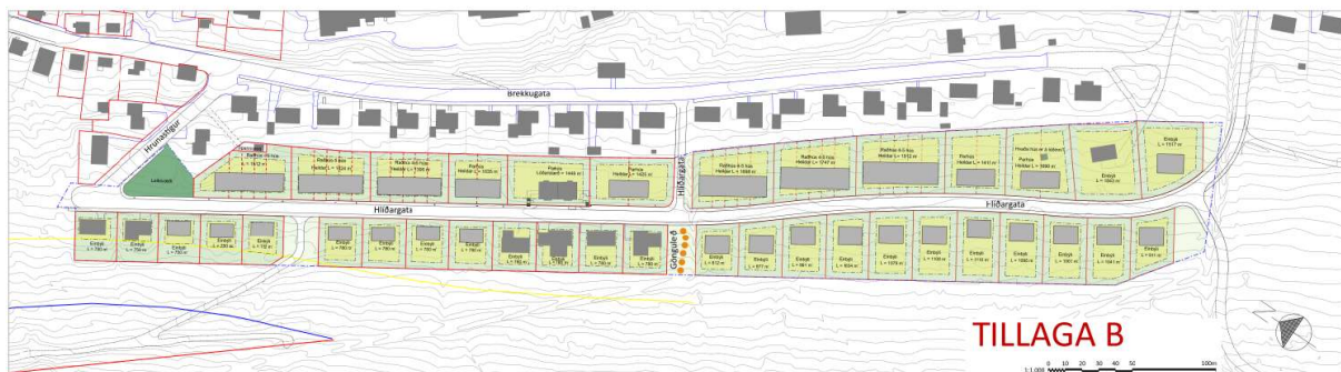
Mynd 1 Tvær útfærslur að vinnslutillögu fyrir Hlíðargötu, sem kynnt var fyrir hverfisráði Þingeyrar.

Skipulags- og mannvirkjanefnd samþykkti á fundi sínum þann 23. febrúar 2022 að leitað yrði umsagnar hverfisráðs Þingeyrar um drög að vinnslutillögu skipulagsins.